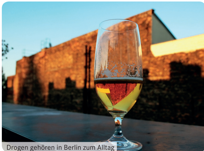
Drogen gehören in Berlin zum Alltag

Bei legalen Drogen regeln diverse Gesetze die Verarbeitung, Herstellung, Verbreitung und den Gebrauch. Illegale Drogen hingegen unterliegen keinerlei staatlicher Kontrolle und stehen so auf dem Schwarzmarkt zum