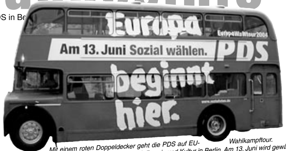
Mit einem roten Doppeldecker geht die PDS auf EU-Wahlkampftour. Vom 6. bis 10. Juni ist der Bus mit Promis und Kultur in Berlin. Am 13. Juni wird gewählt.