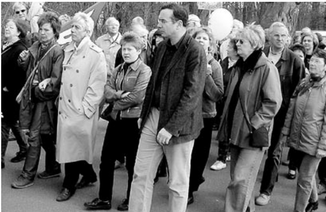
Fretzdorf: Petra Pau (PDS im Bundestag), Harald Wolf (Senator) und Wolfgang Gehrcke (PDS-Vorstand) beim Ostermarsch gegen das Tempodrom.

Aktueller und umfassender als bei der PDS im Netz ist die Arbeit von Gesine Lötzsch und Petra Pau übrigens via www.gesine-loetzsch.de und www.petra-pau.de nachvollziehbar.